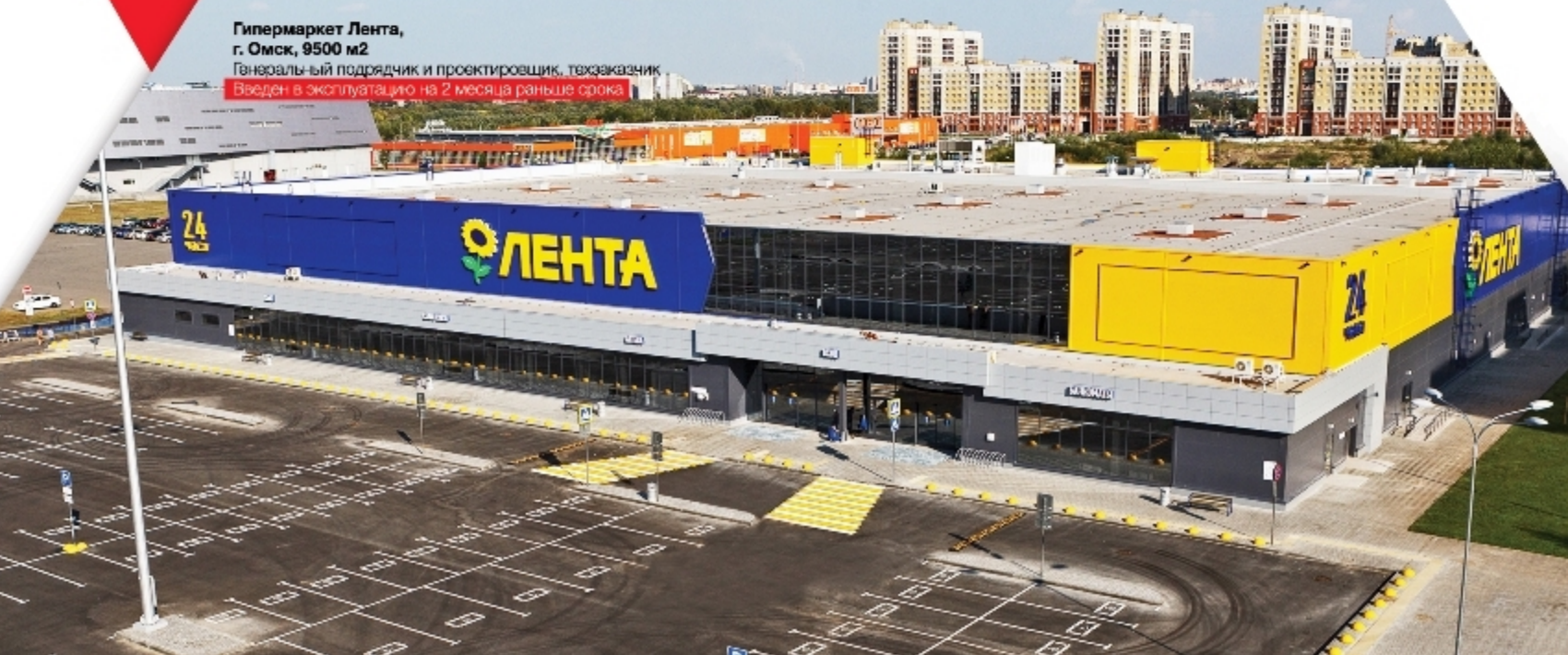
Гипермаркет Лента, г. Омск, 9500 м2 Генеральный подрядчик и проектировщик, техзаказчик Введен в эксплуатацию на 2 месяца раньше срока