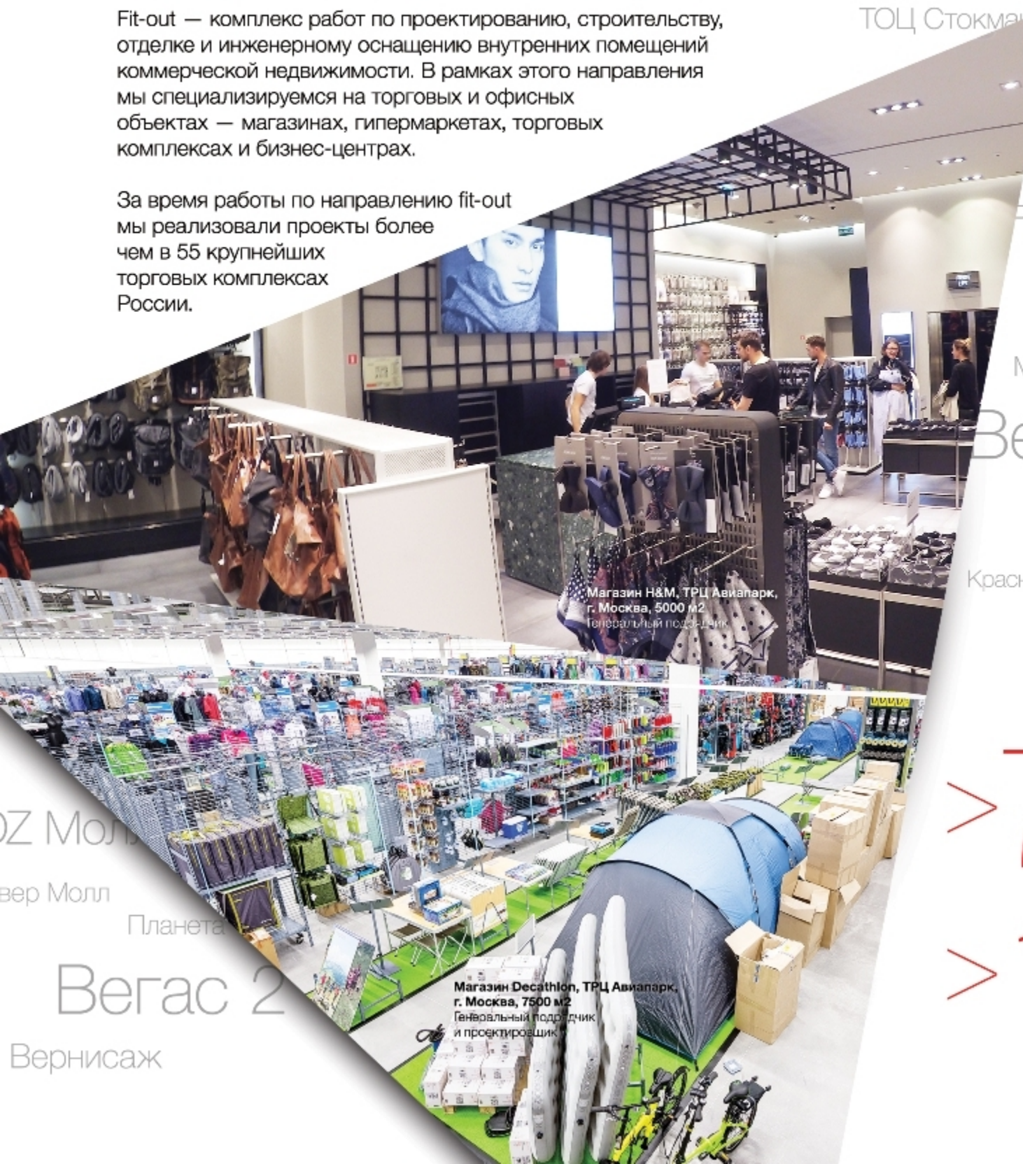
Магазин H&M, ТРЦ Авиапарк, г. Москва, 5000 м2 Генеральный подрядчик

За время работы по направлению fit-out мы реализовали проекты более чем в 55 крупнейших торговых комплексах России.