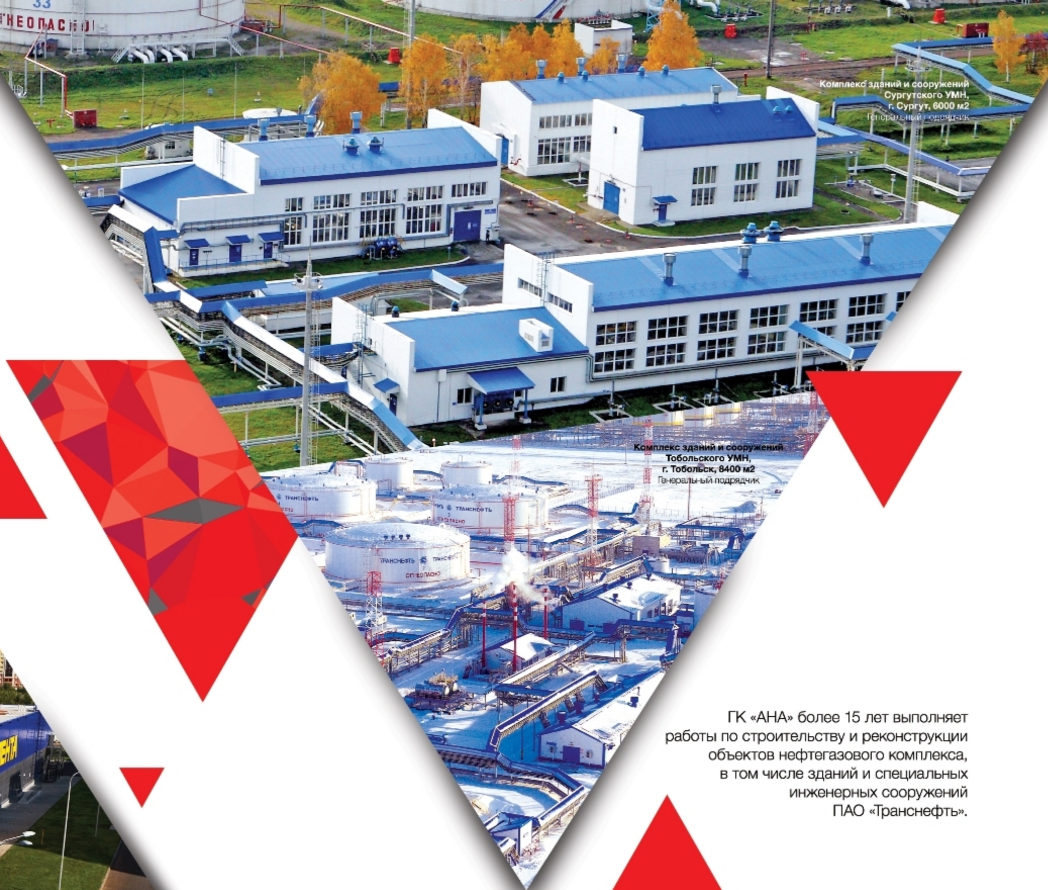
Комплекс зданий и сооружений Сургутского УМН, г. Сургут, 6000 м2 Генеральный подрядчик