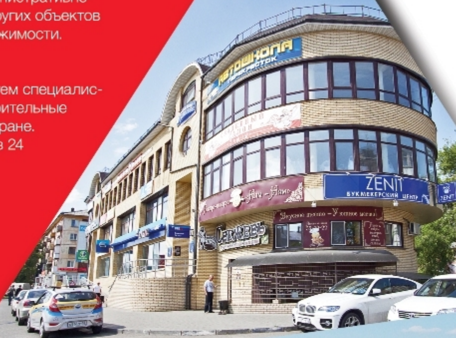
Гипермаркет Лента, г. Тюмень, 12500 м2 Генеральный подрядчик и проектировщик, техзаказчик Введен в эксплуатацию на 1,5 месяца раньше срока